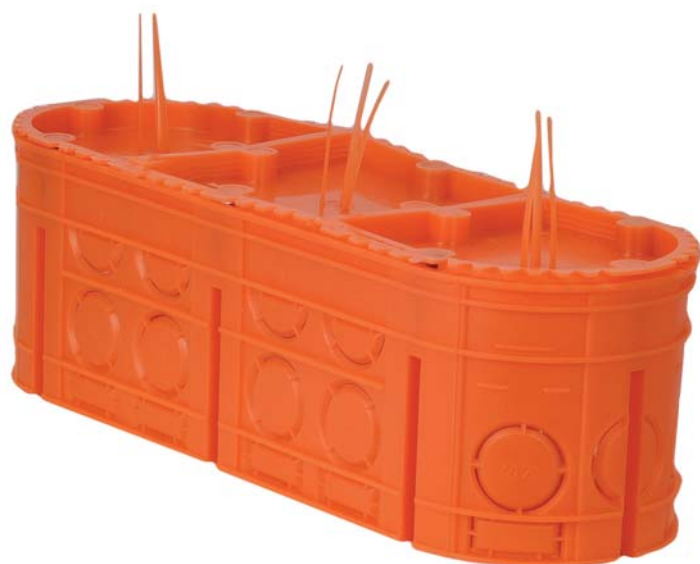
Rys. 7. Przed otynkowaniem przestrzeni puszki M2x60F zamyka się pokrywami sygnalizacyjnymi PS1 i PS2 – dla oznaczenia miejsca osadzenia puszki

na zastosować pokrywy sygnalizacyjne z tzw. „wąsami” (zamiennik wcześniej stosowanej pomiętej gazety wciśniętej w korpus puszki). Służą do tego dwa typy pokryw: PS1 – do zakrywania skrajnych pól puszki oraz PS2 – do zamknięcia części centralnej puszki (w puszkach 3-, 4- i 5-polowych). Oznacza to, że aby zakryć w pełni puszkę M2x60F trzeba użyć dwóch pokryw PS1, a w przypadku puszki M3x60F dwóch pokryw PS1 oraz pojedynczej (w środku) pokrywy PS2.