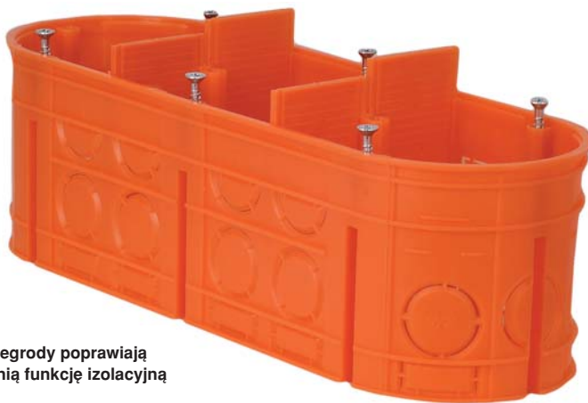
Rys. 3. Wewnętrzne przegrody poprawiają sztywność i pełnią funkcję izolacyjną oraz separującą

malnie dużej przestrzeni montażowej i użytkowej. Wielkość tej przestrzeni została określona w konstrukcji produktu jako priorytet. Jest to istotne dla elektroinstalatorów, ponieważ w puszkach montuje się coraz więcej wyposażenia, a ich wymiary muszą pozostawać tradycyjne, chociażby ze względu na stosowanie standardowych narzędzi wykrawających otwory, jak i niekiedy z powodu ograniczonej przestrzeni.