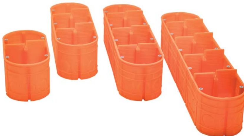
Rys. 2. Seria Multiwall składa się z czterech wersji: 2-, 3-, 4- i 5-polowej

suwania przegrody została tu przewidziana opcjonalnie – przegrodę można po prostu usunąć, gdy jest niepotrzebna. Stosowanie przegród wynika z zasady odizolowania elementów elektrycznych od elektronicznych w miejscach, gdzie sąsiadują one ze sobą. Przegrody poprawiają również sztywność całej konstrukcji puszek, które ze względu na długie ścianki boczne mogłyby ulegać deformacji pod wpływem prac murarskich. Wewnątrz puszek nie ma żadnych przewężeń, dla uzyskania maksy-