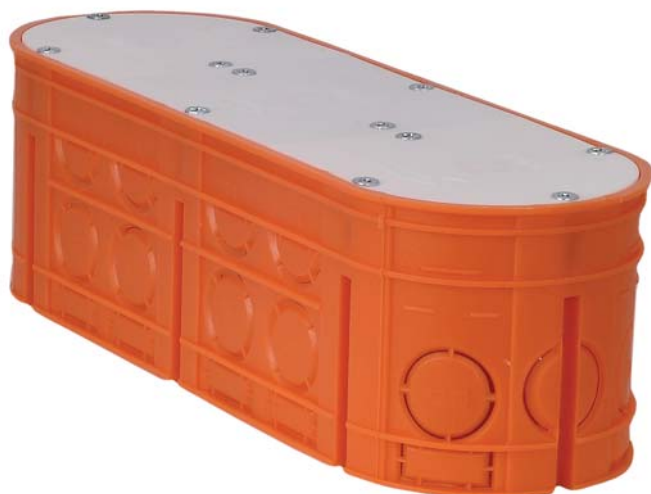
Rys. 6. Po zamknięciu pokrywami PM1 i PM2 puszka pełni rolę rozgałęźnej