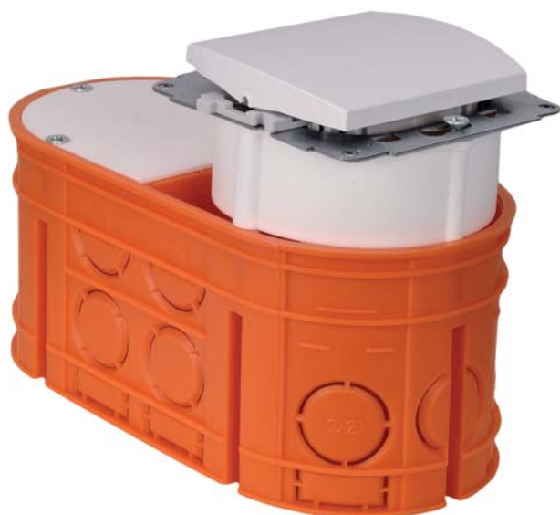
Rys. 5. Mocowanie osprzętu na puszcze M2x60F z wykorzystaniem pokrywy PM1 i pierścienia PD60x24