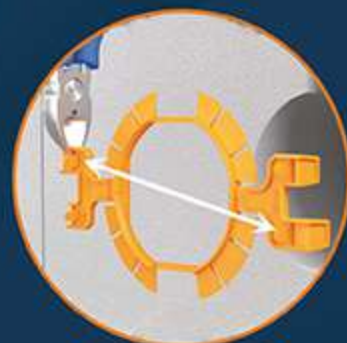
Obcinając diagonalnie łapki wybieramy głębokość osadzenia puszek