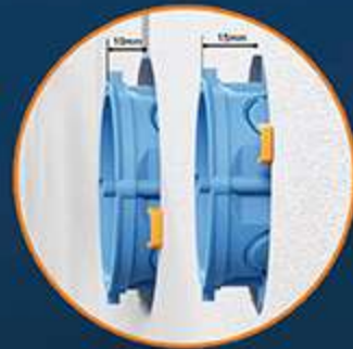
Wybór głębokości osadzenia puszek: 10 mm; 15 mm Zakres: 0 - 20 mm