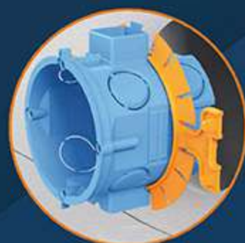
Montaż pierścienia na „klik”