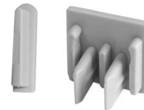
Rys. 4. Zaślepki krańcowe

Zaślepki krańcowe możemy także zakupić osobno jako element wyposażenia szyn.