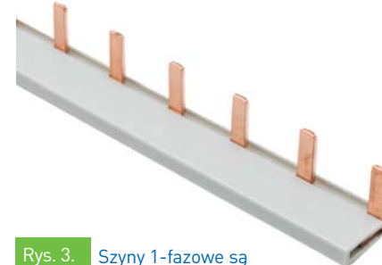
Rys. 3. Szyny 1-fazowe są zgięte pod kątem 90°

i nie powodują jego uszkodzenia. Jednocześnie pojedynczy tor prądowy w naszych szynach jest zatrzaskiwany w listwie izolacyjnej.