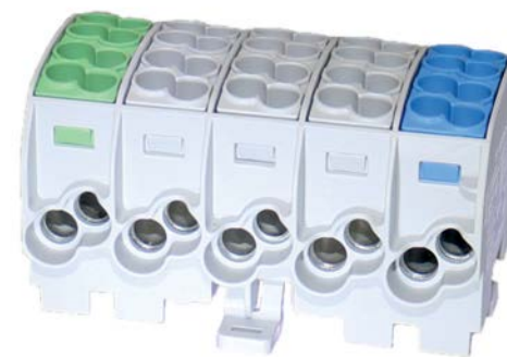
Fot. 2. Blok rozdzielczo-odgałęźny Al/Cu SCB 25-5X SIMBLOCK

odnoszą się do rzeczywistych kolorów przyłączanych przewodów. Cechą szczególną dla STB od 95 mm 2 do 300 mm 2 jest posiadanie w swojej budowie dodatkowego miejsca na tzw. złącze pomiarowe. Daje ono możliwość kontroli nad stanem połączenia przewodów w konkretnych miejscach oraz monitoringu całej instalacji. Kształt obudowy każdej złączki STB gwarantuje ochronę dłoni monterów. Całość estetycznego wyglądu STB dopełnia osłona przeciwpływa (OSTB) z miejscem na umieszczenie oznaczenia (L1,L2,L3,N).