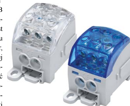
Fot. 3. Bloki rozdzielcze uniwersalne Al/Cu SUB 220 SIMBLOCK

SUB zajmuje szczególne miejsce w całej kategorii SIMBLOCK. To produkty o przekrojach wejścia od 2,5 mm 2 do 185 mm 2 dla przewodów typu drut i linka oraz od 1,5 mm 2 do 150 mm 2 dla przewodów wyposażonych w końcówki tulejkowe. Daje to nieograniczoną możliwość połączenia przewodów o różnych rozmiarach i kształtach. Zaletą tych bloków jest ergonomiczny kształt i unikatowa budowa. SUB został zaprojektowany tak, aby był dopasowany do wewnętrznego kształtu dłoni instalatora. Jego łagodne zaokrąglenia ułatwiają manualną pracę przy montowaniu przewodów oraz zabezpieczają montera przed niepożądanym dotykiem części czynnej rdzenia. Przezroczysta pokrywa SUB umożliwia kontrolę każdego z przyłączanych i rozdziela-