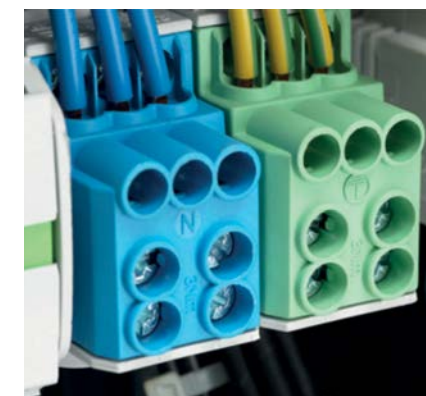
Fot. 4. Bloki rozdzielcze dystrybucyjne Al/Cu SDB SIMBLOCK

nych przewodów. Cyfrowe i literowe oznaczenia intuicyjnie prowadzą montera po kanałach wejściowych i wyjściowych. Jednocześnie SUB posiada w obudowie specjalnie przygotowane miejsca do realizacji połączeń przewodami okrągłymi oraz płaskimi.